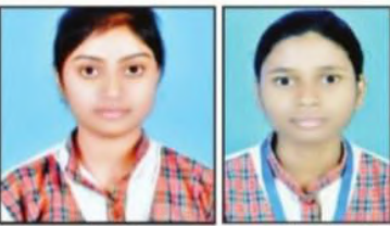
जेडई एडवांस के लिए क्वालीफाई डीएवी के विद्यार्थी